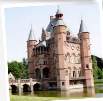
Vakantiewoning Kasteel Ten Torre