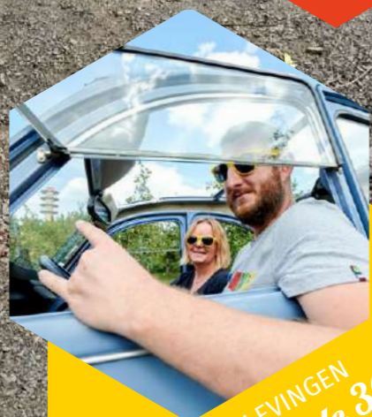
BELEVINGEN Bladzijde 36