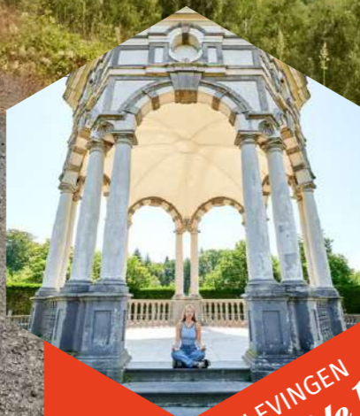
BELEVINGEN Bladzijde 19