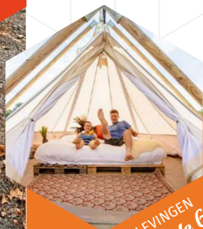
BELEVINGEN Bladzijde 69