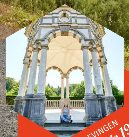
BELEVINGEN Bladzijde 19