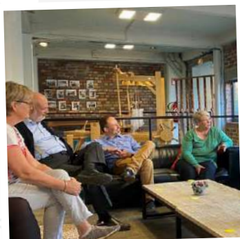
Geef je rondleidingen een boost