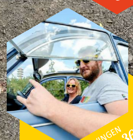
BELEVINGEN Bladzijde 36