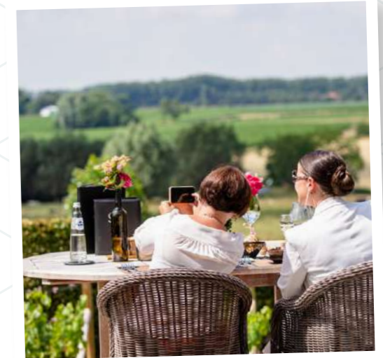
WineHotSpot - Coaching om wijnbeleving te laten evolueren

De partners van het project Tourism Lab identificeerden gezamenlijk verschillende actielijnen die verder werden uitgewerkt in het kader van co-creatieworkshops . 'Boost je rondleidingen', 'Unieke plaatsen: inspiratie voor hybride gebruik', 'Geef klank aan je bestemming', 'Design Thinking' en 'De ontwikkeling van individuele of regionale belevingen' zijn enkele voorbeelden van thema's die aan bod kwamen tijdens de collectieve sessies.