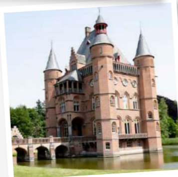
Vakantiewoning Kasteel Ten Torre