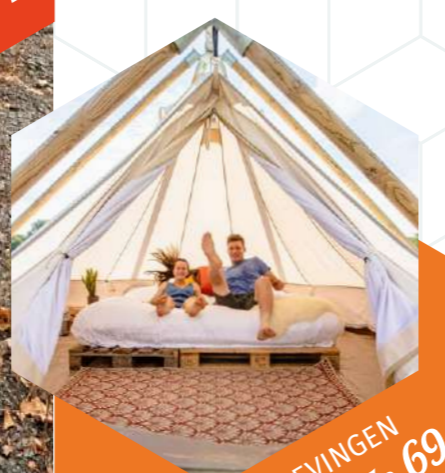
BELEVINGEN Bladzijde 69