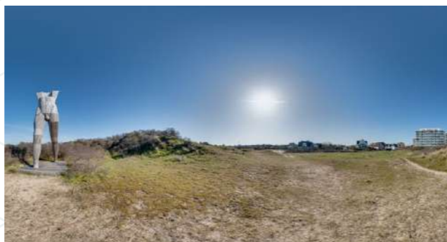
Christophorus, Gerhard Lentink, Beaufort 2003 De Panne